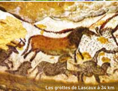
Les grottes de Lascaux à 34 km