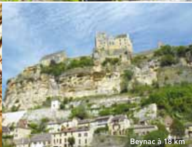
Beynac à 18 km