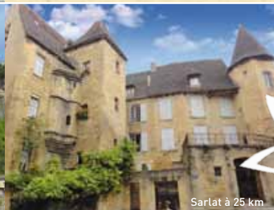
Sarlat à 25 km